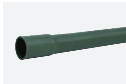
Tramo de 3 metros.